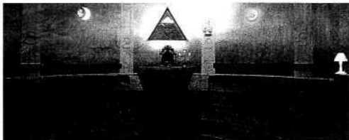
Gran Oriente de Francia. Era uno de las sedes más importantes y antiguas por la cantidad de miembros que tenía.