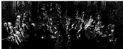
Reunión de cofrades. Representación del accionar de las logias. Los modelos europeos tuvieron gran influencia en América.

Bernabé González Riso 27 transcribe un artículo del citado periódico Le Belge, L'ami du Roi et de la patrie del 1º de enero de 1825 en el que se describe: "C'avo la Autlémes amitté-